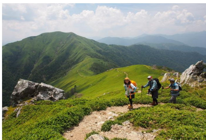
▲ 次郎笈から剣山頂へ