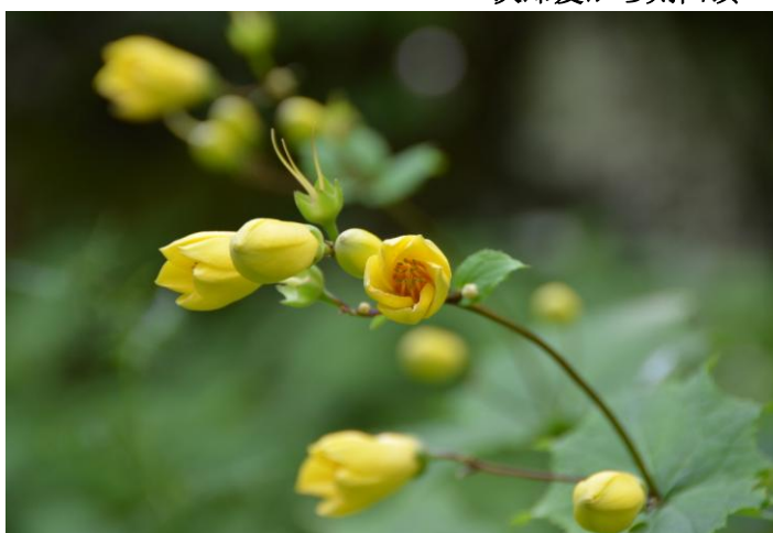
▲ キレンゲシヨウマ

うだる暑さの下界におさらばし花と涼を求めるチームと剣&次郎笈の2チームで《剣山》を訪ねました。一面の笹原を渡る風は涼しくキレンゲシヨウマの花も可愛く其々に満足の山行でした♪