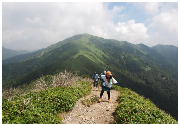
▲ 剣山を背に次郎笈へ